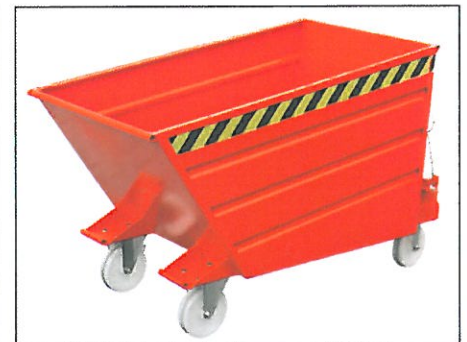
Typ VD mit Rollen